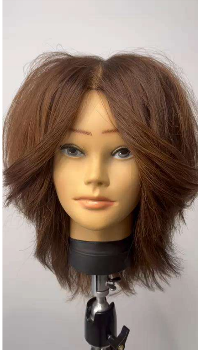
C1 - Internal use